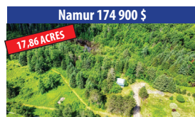
Namur 174 900 $ 17,86 ACRES OPPORTUNITÉ POUR INVESTISSEUR AVEC CHARMANT RUISSEAU, ZONE BLANC. SIA : 20585954 - SIMON