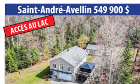
Saint-André-Avellin 549 900 $ ACCÈS AU LAC ACCÈS NOTARIÉ AU LAC-HOTTE AVEC QUAI, SUPERBE PROPRIÉTÉ DE 2 CHAMBRES À COUCHER, PRÈS DE 1 ACRE DE TERRAIN, GARAGE INTÉGRÉ, PETITE ÉRABLIÈRE. SIA : 20240099 - SIMON