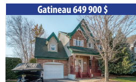
Gatineau 649 900 $ MAGNIFIQUE PROPRIÉTÉ CLÉ EN MAIN, COMPREND 3 CHAMBRES À COUCHER, SOUS-SOL AMÉNAGÉ, GARAGE ATTACHÉ ET ALLÉE. PAVÉE. SIA : 21871012 - SIMON