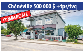
Chénéville 500 000 $ + tps/tvq COMMERCIALE RESTAURANT LA VILLA DU BIFTECK, TRÈS BON REVENU, ÉTABLIE DEPUIS 1977 (69 PLACES INTÉRIEURES ET 44 PLACES EXTERIEURES). SIA : 28940915 - SIMON