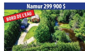
Namur 299 900 $ BORD DE L'EAU MAGNIFIQUE PROPRIÉTÉ DE 4 CHAMBRES À COUCHER SUR LE BORD DE LA PETITE RIVIÈRE ROUGE, GRAND GARAGE DÉTACHÉ. SIA : 19613639 - SIMON