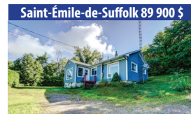
Saint-Émile-de-Suffolk 89 900 $ PROPRIÉTÉ 4 SAISONS DE 2 CHAMBRES À COUCHER, AU COEUR DU VILLAGE. SIA : 14211119 - SIMON