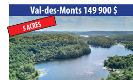
Val-des-Monts 149 900 $ 5 ACRES DEUX ACCÈS NOTARIÉS DONT UN SUR LA LAC NOIR ET UN AU LAC MCGREGOR, GRANDE PLAGE DE SABLE. SIA : 27493976 - SIMON