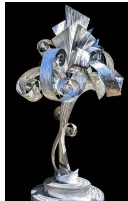
L'œuvre « Flots » de l'artiste sculpteur Béla Simó, en collaboration avec Angèle Lux.

L'appel de propositions pour l'œuvre du secteur de Gatineau est lancé depuis le 13 décembre 2022 et se poursuivra jusqu'au 26 mai 2023.