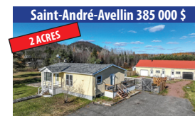
Saint-André-Avellin 385 000 $ 2 ACRES MAISON DE CAMPAGNE DE 3 CHAMBRES À COUCHER, GRANDE GRANGE (ATELIER, BOUTIQUE) DE 26X60. SIA : 13832924 - SIMON