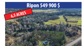
Ripon 549 900 $ 6,5 ACRES DOMAINE OU FERMETTE AVEC RUISSEAU, PROPRIÉTÉ DE 2 CHAMBRES À COUCHER. SIA : 28983318 - SIMON