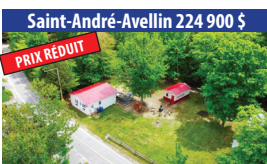
Saint-André-Avellin 224 900 $ PRIX RÉDUIT ACCÈS NOTARIÉ AU LAC SIMON, JOLIE PROPRIÉTÉ DE 2 CHAMBRES À COUCHER, CLÉ EN MAIN, NAVIGABLE. SIA : 24116128 - SIMON