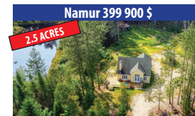
Namur 399 900 $ 2,5 ACRES BORDÉ PAR L'EAU, JOLIE PROPRIÉTÉ DE 3 CHAMBRES À COUCHER, CONSTRUCTION 2009 À QUELQUES MINUTES DES SERVICES. SIA : 18070414 - SIMON