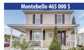
Montebello 465 000 $ IMPRESSIONNANTE PROPRIÉTÉ DE 4 CHAMBRES À COUCHER, GRANDE COUR ARRIÈRE CLÔTURÉE, PRÈS DU VILLAGE. SIA : 10785296 - SIMON