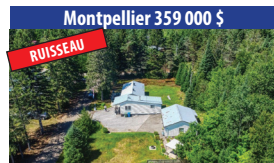
Montpellier 359 000 $ RUISSEAU BELLE PROPRIÉTÉ SUR LE RUISSEAU SCHRYER, GRAND GARAGE DOUBLE DÉTACHÉ, SPA INTÉRIEUR. SIA : 16656884 - SIMON