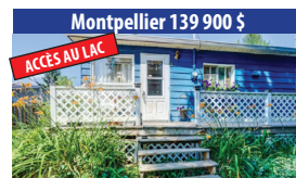
Montpellier 139 900 $ ACCÈS AU LAC CHARMANTE MAISON DE CAMPAGNE, ACCÈS NOTARIÉ AU LAC-SCHRYER, NAVIGABLE. SIA : 17371734 - SIMON