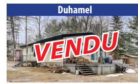
Duhamel VENDU PROPRIÉTÉ 3 SAISONS DE 2 CHAMBRES À COUCHER SUR LE GRAND LAC SIMON, PLAGE DE SABLE. SIA : 27196735 - SIMON