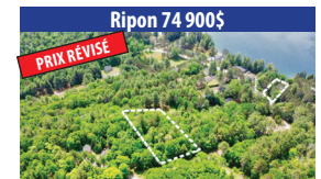
Ripon 74 900 $ PRIX RÉVISÉ TERRAIN BOISÉ AVEC 2 ACCÈS À L'EAU, PRÈS DES SERVICES, 1 ACCÈS AU LAC VICEROY ET L'AUTRE ACCÈS À LA RIVIÈRE PETITE-NATION. SIA : 14491279 - SIMON