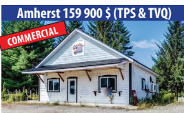
Amherst 159 900 $ (TPS & TVQ) COMMERCIAL RESTO CASSE-CROÛTE, SALLE À MANGER, GRAND STATIONNEMENT. SIA : 17532478 - SIMON