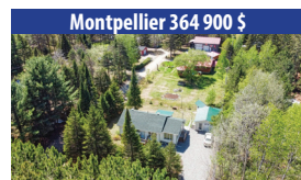
Montpellier 364 900 $ CHARMANTE PROPRIÉTÉ DE 5 CHAMBRES À COUCHER, CLÉ EN MAIN, SOUS-SOL AMÉNAGÉ, GARAGE DÉTACHÉ. SIA : 14444803 - SIMON