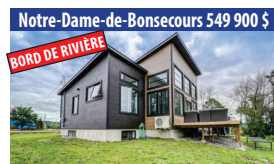
Notre-Dame-de-Bonsecours 549 900 $ BORD DE RIVIÈRE CONSTRUCTION NEUVE 2022, PROPRIÉTÉ DE 4 CHAMBRES À COUCHER, BORD DE RIVIÈRE AU SAUMON. SIA : 13642173 - SIMON