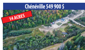
Chénéville 549 900 $ 14 ACRES FERMETTE, PROPRIÉTÉ DE 4 CHAMBRES À COUCHER, SOUS-SOL AMÉNAGÉ, GARAGE DE 16X36, GRANGE DE 20X24, CLÉ EN MAIN. SIA : 1414995 - SIMON