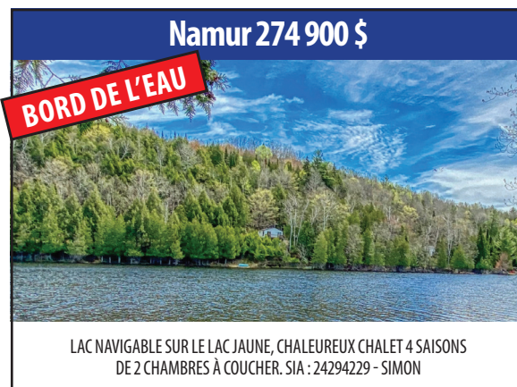
Namur 274 900 $ BORD DE L'EAU LAC NAVIGABLE SUR LE LAC JAUNE, CHALEUREUX CHALET 4 SAISONS DE 2 CHAMBRES À COUCHER. SIA : 24294229 - SIMON