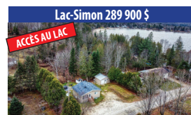
Lac-Simon 289 900 $ ACCÈS AU LAC ACCÈS NOTARIÉ AU LAC-SIMON AVEC PLAGE DE SABLE, PROPRIÉTÉ CLÉ EN MAIN DE 2 CHAMBRES À COUCHER, GARAGE DÉTACHÉ. SIA : 24874513 - SIMON