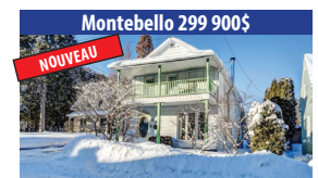
Montebello 299 900 $ NOUVEAU CHARMANTE PROPRIÉTÉ DE 3 CHAMBRES À COUCHER, 2 MINUTES DU VILLAGE, COURS ARRIÈRE INTIME. SIA : 25270856 - SIMON