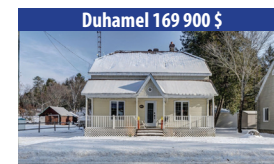
Duhamel 169 900 $ COQUETTE MAISON DE 4 CHAMBRES À COUCHER AU COEUR DU VILLAGE, GRAND GARAGE DÉTACHÉ, CLÉ EN MAIN. SIA : 13759166 - SIMON