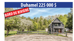
Duhamel 225 000 $ BORD DE RIVIÈRE BÂTIMENT PEUT ÊTRE TRANSFORMÉE EN CHALET, BORDÉ PAR LA RIVIÈRE PRESTON À PROXIMITÉ DU LAC-SIMON ET LAC GAGNON, PROPRIÉTÉ CENTENAIRE OFFRANT PLUSIEURS POSSIBILITÉS. SIA : 28869100 - SIMON