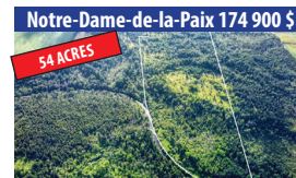
Notre-Dame-de-la-Paix 174 900 $ 54 ACRES TERRE AGRICOLE BORDÉE PAR LA PETITE RIVIÈRE ROUGE, GARAGE SUR PLACE. SIA : 10056039 - SIMON