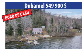
Duhamel 549 900 $ BORD DE L'EAU MAGNIFIQUE CHALET RUSTIQUE DE 2 CHAMBRES À COUCHER, SITUÉ AU BORD DU GRAND LAC-GAGNON, COUCHER DE SOLEIL, CLÉ EN MAIN, COUP DE COEUR ASSURÉ. SIA : 28434315 - SIMON