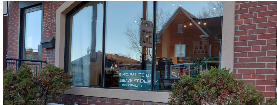
La Municipalité de Mulgrave-et-Derry prévoit dans son Programme triennal d'immobilisation investir en 2023 plus de 1,6 million de dollars pour son centre multifonctionnel.

Une somme de 600 000 $ aurait déjà été recueillie par la Municipalité, assure-t-il, et ils sont présentement à la recherche de d'autres subventions. « Si tout va bien », l'objectif est de présenter le projet à la population « lors des mois qui viennent » et de terminer les travaux pour le printemps 2024.