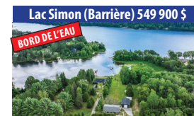
Lac Simon (Barrière) 549 900 $ BORD DE L'EAU JOLIE PROPRIÉTÉ DE 3 CHAMBRES À COUCHER, BORD DU LAC-SIMON (LAC-BARRIÈRE), PRÈS DE 1 ACRE DE TERRAIN, GARAGE DÉTACHÉ, SOLARIUM. SIA : 16392121 - SIMON