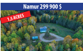
Namur 299 900 $ 1,5 ACRES JOLIE PROPRIÉTÉ DE 3 CHAMBRES À COUCHER, CLÉ EN MAIN, SOUS-SOL COMPLÈTEMENT AMÉNAGÉ, REMISE ET GARAGE DÉTACHÉ. SIA : 23828773 - SIMON