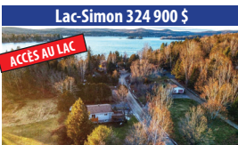
Lac-Simon 324 900 $ ACCÈS AU LAC PLAGE DE SABLE, PROPRIÉTÉ 4 SAISONS DE 3 CHAMBRES À COUCHER, CLÉ EN MAIN. SIA : 24375714 - SIMON