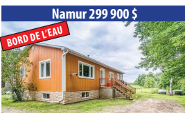
Namur 299 900 $ BORD DE L'EAU MAGNIFIQUE PROPRIÉTÉ DE 4 CHAMBRES À COUCHER, BORD DE LA RIVIÈRE PETITE ROUGE, SOUS-SOL ENTièrement AMÉNAGÉ, GRAND GARAGE DÉTACHÉ. SIA : 19613639 - SIMON