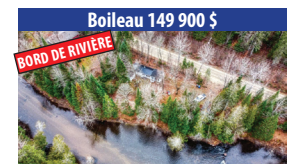
Boileau 149 900 $ BORD DE RIVIÈRE BORD DE RIVIÈRE MASKINONGÉ, CHALET 3 SAISONS DE 2 CHAMBRES À COUCHER, PLUS DE 1,32 ACRES, PROPRIÉTÉ COMPREND 2 TERRAINS. SIA : 27249837 - SIMON