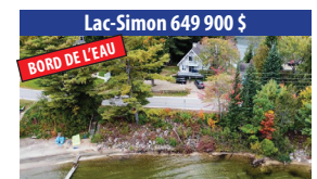
Lac-Simon 649 900 $ BORD DE L'EAU CHARMANTE PROPRIÉTÉ DE 6 CHAMBRES À COUCHER, SITUÉ À LAC-SIMON (BARRIÈRE), SOUS-SOL AMÉNAGÉ, GRAND GARAGE DÉTACHÉ. SIA : 12209267 - SIMON