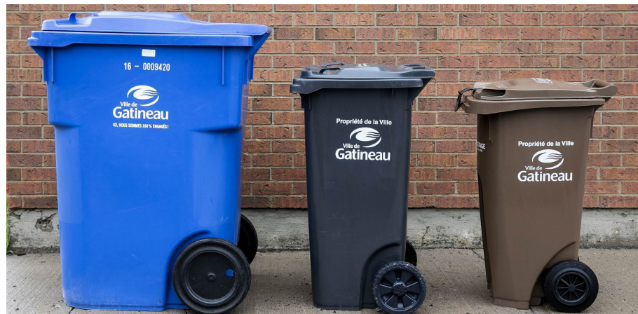
Avec son PGMR, la Ville de Gatineau aspire notamment à une devenir une ville zéro déchet.