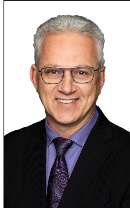
Le député d'Argenteuil-La Petite-Nation, Stéphane Lauzon, se dit en accord avec les nouvelles limites proposées.