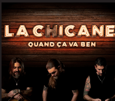
LA CHICANE 28 avril