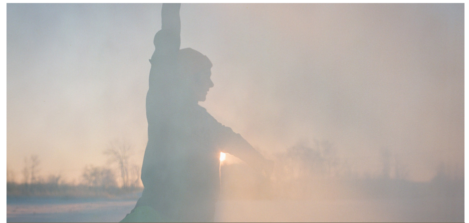
L'organisme Devenir(s) corps, localisé à Montpellier, pourra lancer sa toute première programmation grâce aux 23 000 $ attribués.

sur trois ans, a été investi par les partenaires pour soutenir des projets de création, de production ou de diffusion favorisant des liens entre les arts et la collectivité. Il s'agissait du deuxième appel à projets pour cette entente.