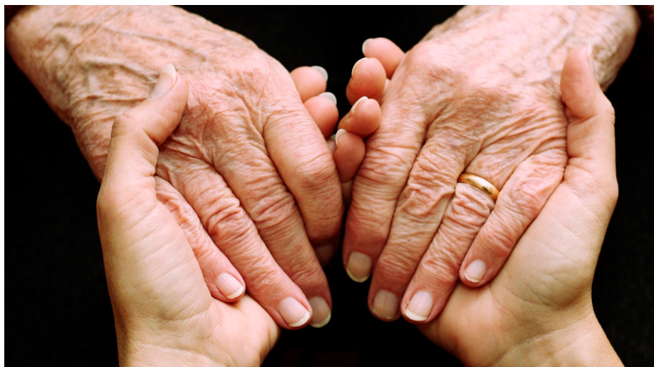
Le programme Nouveaux Horizons pour les aînés (PNHA) vise essentiellement à financer des projets ciblant l'améliorer de la qualité de vie des aînés et qui leur permet de continuer de participer pleinement à leur collectivité.