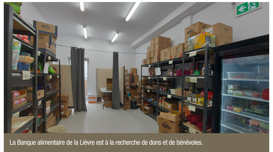
La Banque alimentaire de la Lièvre est à la recherche de dons et de bénévoles.