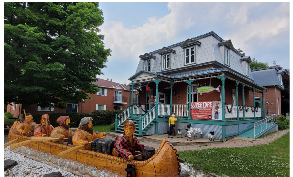
La programmation complète des trois jours de festivités prévues à Plaisance du 23 au 25 juin se trouve sur le site internet maisonartpopulaire.ca.

Il y a aussi onze occasions de découvrir d'autres artistes dans le Centre d'art populaire du Québec tout au long de la saison. En observant chaque œuvre, une question se pose au-delà du résultat qui s'offre à chaque observateur de l'univers