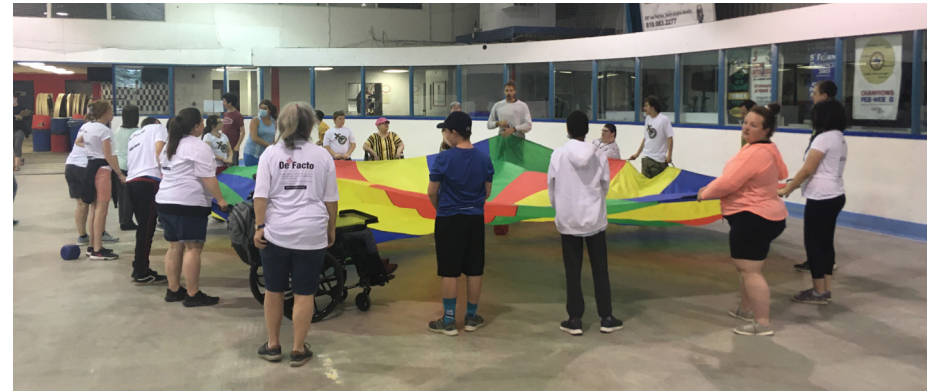
Une activité avec un parachute lors de la 3e édition des Olympiades organisées par la Corporation des loisirs de Papineau.

Les olympiades se sont déroulées dans le cadre du défi Ensemble, on bouge, une initiative nationale d'activité physique de ParticipACTION, du 1er au 30 juin. Celle-ci encourage tout le monde à bouger ensemble pendant tout le mois. À l'issue de ces 30 jours, la communauté la plus active du Canada remportera le premier prix de 100 000 $, qui sera consacré à la réalisation d'initiatives locales de sport et d'activité physique.