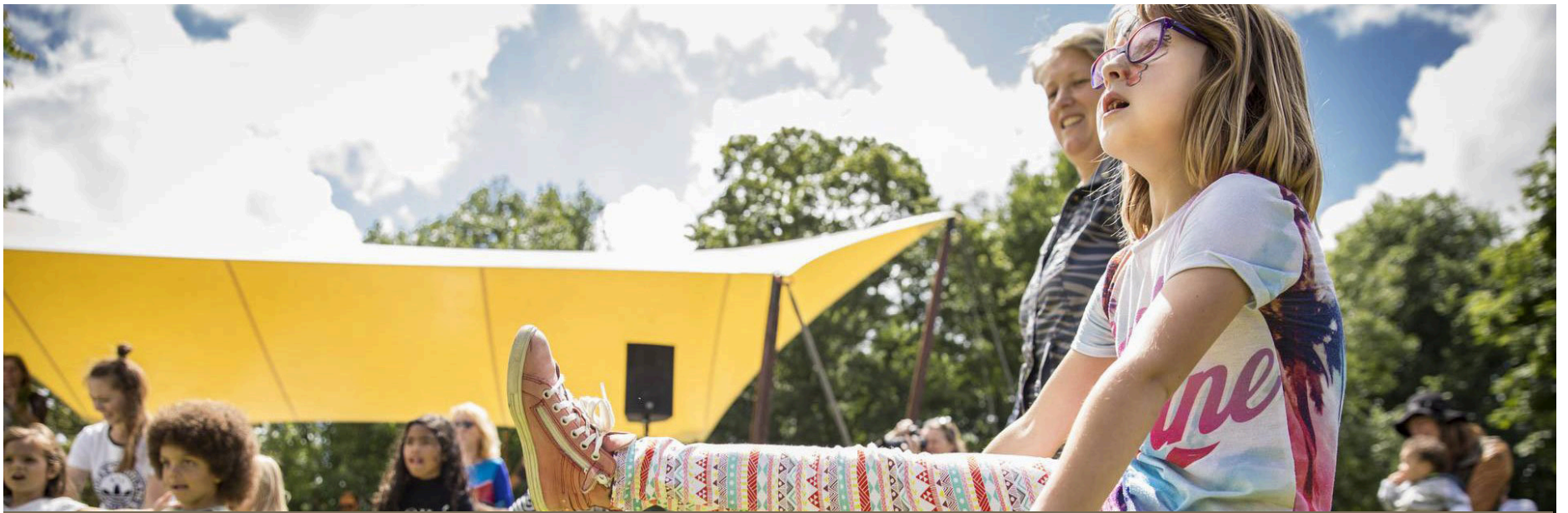
Plusieurs activités pour toute la famille sont prévues.