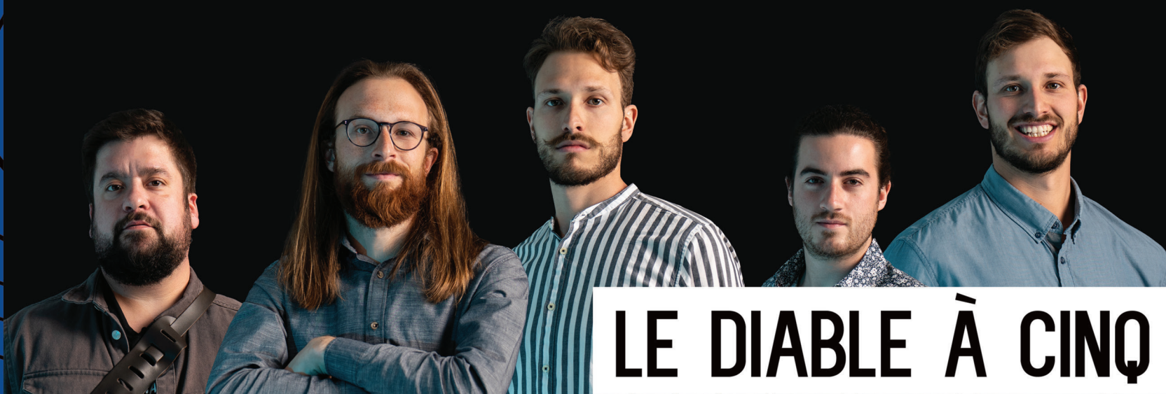
LE DIABLE À CINQ