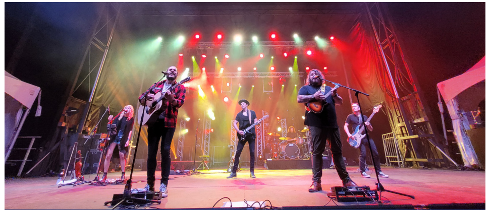
Les 2 Frères ont pu entendre la foule chanter avec eux, plusieurs de leurs compositions.