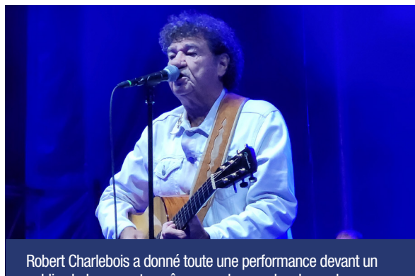
Robert Charlebois a donné toute une performance devant un public chaleureux et a même revu les paroles de sa chanson « Je reviendrai à Montréal » pour leur donner une couleur d'actualité à Thurso.