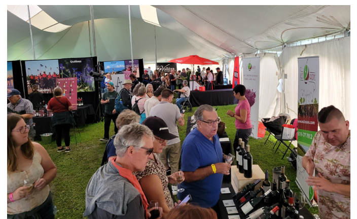
Le festival des vins a également été un succès en accueillant sur deux jours les amateurs de vins et spiritueux.