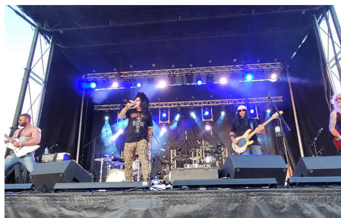
Le Rock show a donné le ton à la soirée de samedi en première partie.