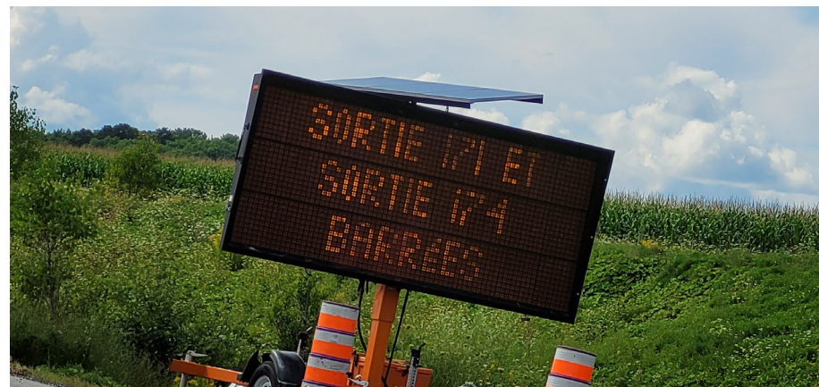
Un panneau du ministère des Transports affiche les fermetures des sorties 174 et 171, juste avant la sortie 187 pour Thurso où il sera possible de rejoindre la route 148.

L'autoroute 50 sera également fermée la nuit dans les deux directions, du lundi au vendredi, entre 21h et 5h le lendemain, pour des travaux de forages, jusqu'au 2 septembre. Pour être informé des dernières mises à jour des travaux en prévision de vos déplacements, n'hésitez pas à consulter le site quebec511.info.