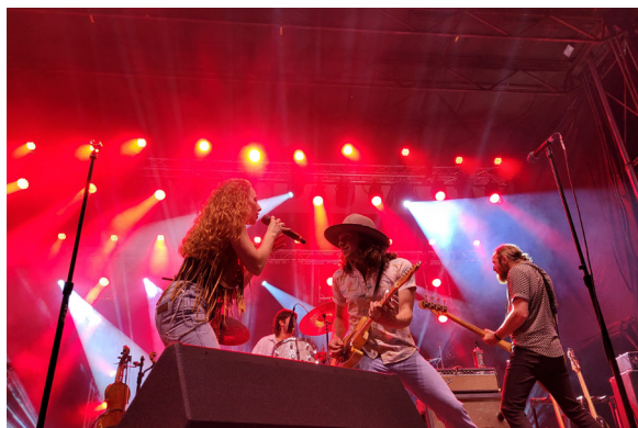
Les Mountain Daisies ont ouvert le festival, en première partie de 2 Frères.