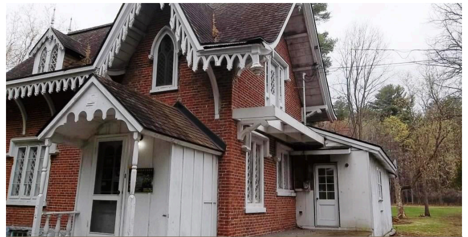
La maison du jardinier à Montebello en 2021.

En vertu de la Loi sur le patrimoine culturel, la MRC dispose d'obligations et de pouvoirs en la matière, affirme l'agente de développement culturel et patrimoine immobilier. La principale obligation de la MRC, c'est de tenir un inventaire du patrimoine immobilier sur son territoire et de