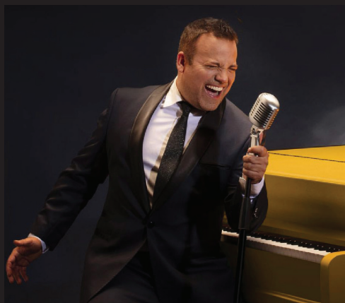
PIANO MAN 2 11 novembre