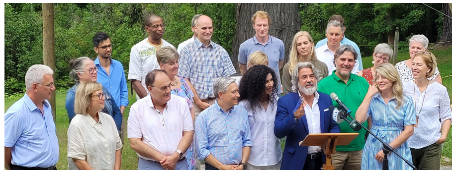
Le Lieutenant politique du Québec, Pablo Rodriguez, lors de sa visite du Manoir-Papineau accompagné de députés libéraux fédéraux du Québec.

La réflexion porte autant sur les solutions envisagées pour rejoindre Lachute-Montréal qu'Ottawa, selon le député d'Argenteuil-La Petite-Nation. « On travaille aussi sur le train rapide Québec-Montréal-Windsor, indique-t-il. Donc c'est dans nos cartons du Gouvernement. Nous, notre rôle, c'est de travailler sur le rabatement pour se rendre à ce train-là. Pour qu'on puisse desservir notre population de ce côté-ci de la rivière. »