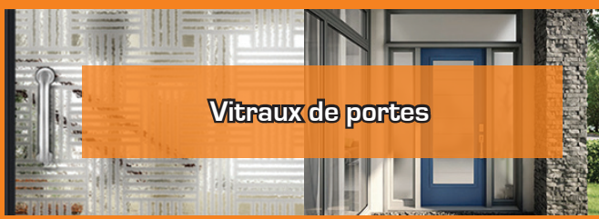
Vitreaux de portes

819 516-1117 | fenproinc@gmail.com | 181-B, rue Principale à Saint-André-Avellin