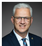
Stéphane Lauzon Député Argenteuil- La Petite-Nation