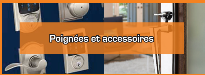
Poignées et accessoires